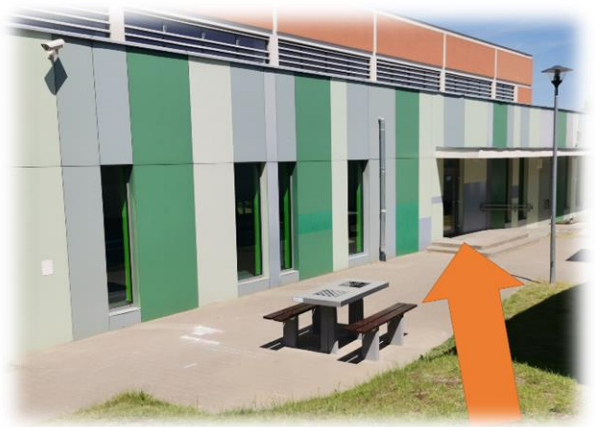
Wejście przez trybuny sali gimnastycznej (kliknij, aby powiększyć)