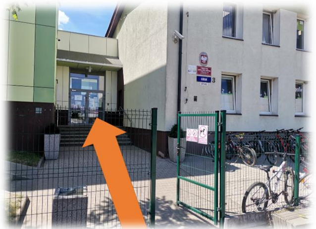
Wejście do szkoły ul. Górna (kliknij, aby powiększyć)

Klasy 8: Uroczysty apel na sali gimnastycznej, indywidualnie dla każdej z klas 8 (uczniowie, nauczyciele, zaproszeni goście, jeden rodzic/prawny opiekun ucznia na sali gimnastycznej, drugi rodzic/prawny opiekun ucznia na trybunach). Obowiązuje nakaz zakrywania ust i nosa w miejscach gdzie nie jest możliwe zachowanie dystansu społecznego 1,5 m.